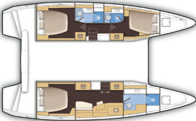
Version 3 cabines, 3 salles d'eau, 2 douches 3 cabin version, 3 bathrooms, 2 showers